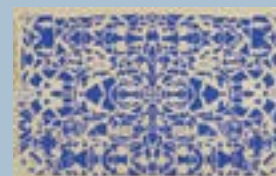
Udstilling af H.C. Andersens papirklip