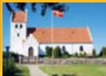
Sandholts Lyndelse Kirke