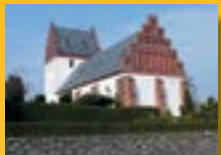
Vester Hæsinge Kirke